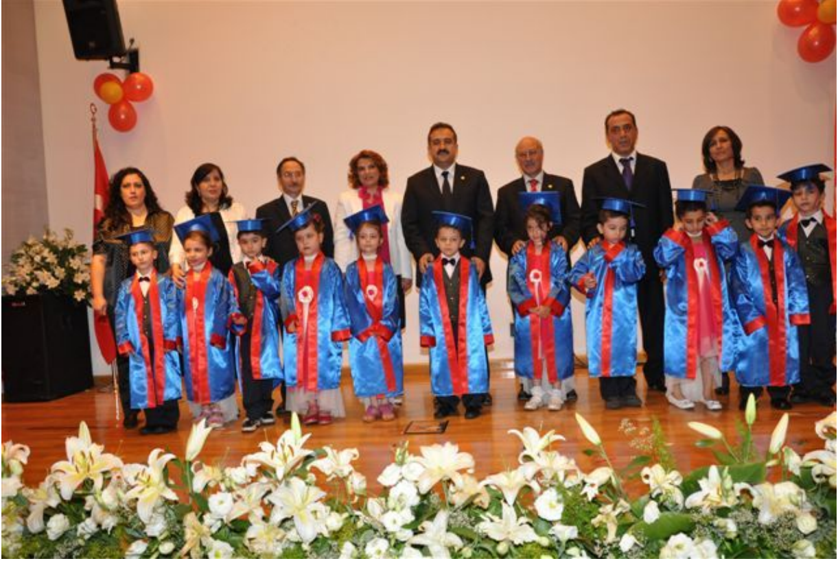
Sayın Bařkanımız Kreř ve Gündüz Bakımevimizden mezun olan miniklerimizle