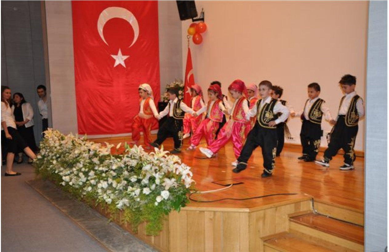
Mezun olan miniklerimiz çeřitli dans ve halk oyunları gösterilerini bařarıyla sergilediler